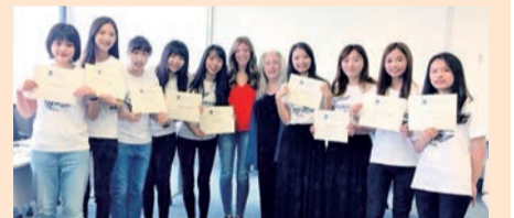
▲亞大護理系獲教育部補助，送學生到美國凱斯西儲大學暨醫院交換、實習，凱斯西儲大學護理學院院長（右五）頒發結業證書給亞大學生。

外文系執行「3加1」海外實習計畫，6年、61位學生到新加坡樟宜機場實習；經管系海外企業實習，7年、46位學生到東南亞國家實習；時尚系每年選送學生到美國紐約吳季剛服裝設計公司實習。休憩系2019年申請教育部「新南向學海築夢」計畫，14位學生到新加坡實習。