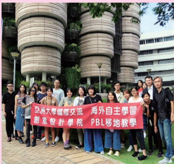
▲亞大創意設計學院師生團隊海外自主教學，在新加坡南洋理工大學The Hive（俗稱小籠包建築物）前合影。