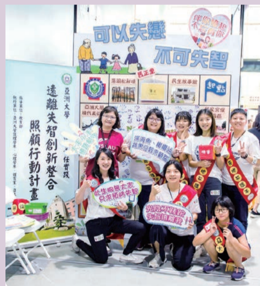
▲護理系USR師生引導民衆進行立體大富翁遊戲、簽名倡議遠離失智（No Dementia），並共同合夥。

首創網路成癮防治，銀髮失智、弱勢學童、菇類產業鏈結、農產品牌提升、霧峰創生等10件社會責任計畫，師生走入社會，解決社會問題，創造幸福。