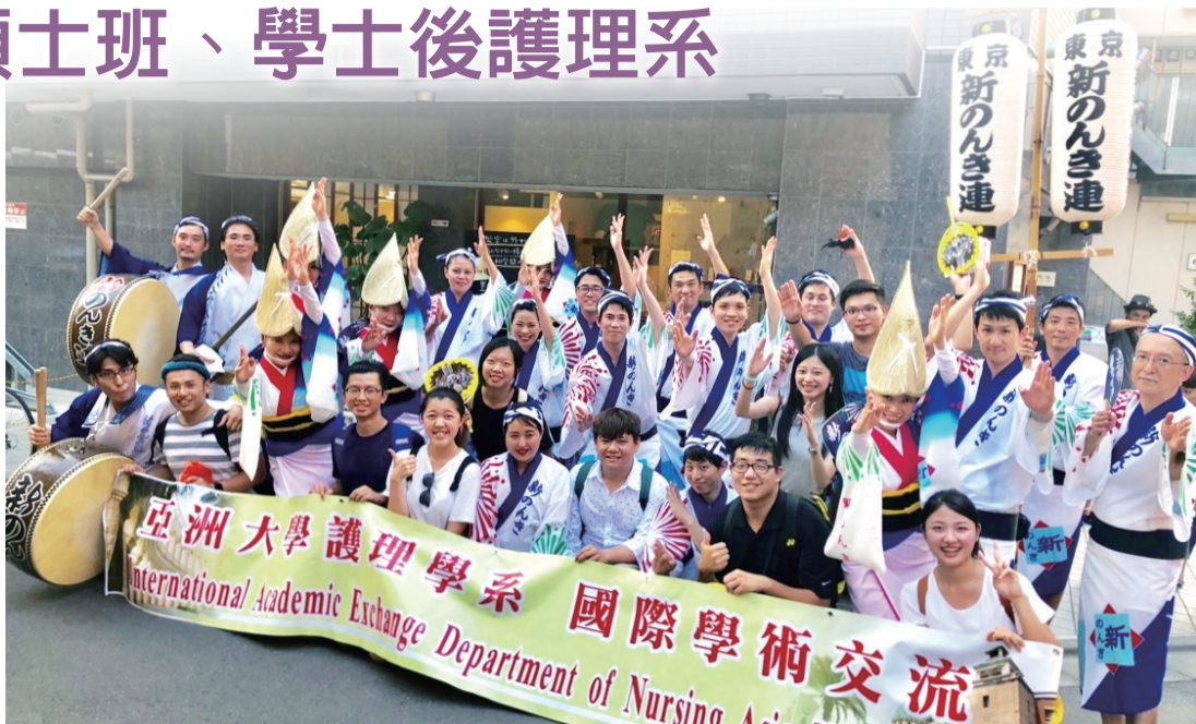
▲亞大護理系學生利用海外實習，課餘深入日本傳統文化，與當地舞者學習阿波舞。

3年前，亞洲大學附屬醫院營運以來，臨床醫學檢驗人才需求增多，109學年度起，亞大生物科技學系更名為「醫學檢驗暨生物技術學系」，下設「醫學檢驗組」及「生物技術組」兩組招生，投入培育基礎醫學人材行列。另因應人口老化，配合政府長照2.0政策，108學年度增設「物理治療學系」，已招收35名學生，未來將擴大招生至50名。